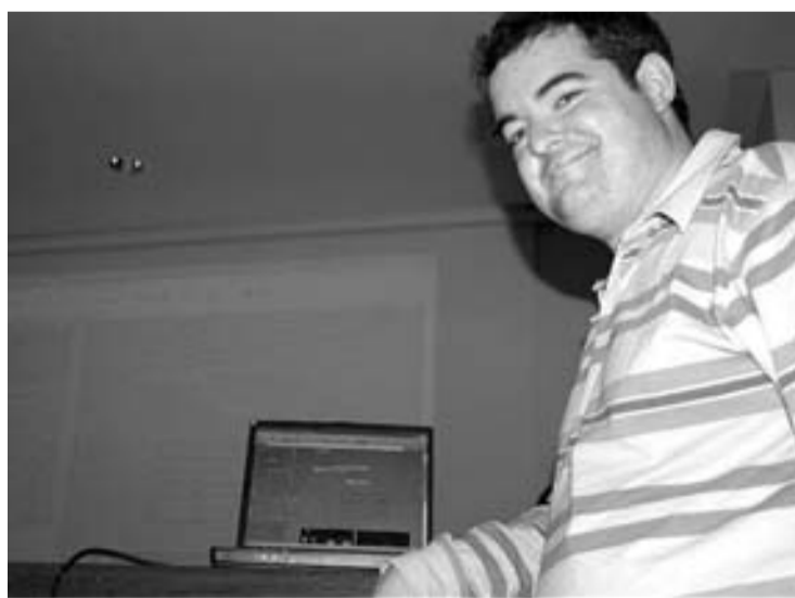
La nueva página se presentó en la noche del pasado miércoles

El acceso a esta web es en realidad un texto en el que se hace un breve repaso por Arrincadeira . También se pueden ver fotos de sus directivos y hay